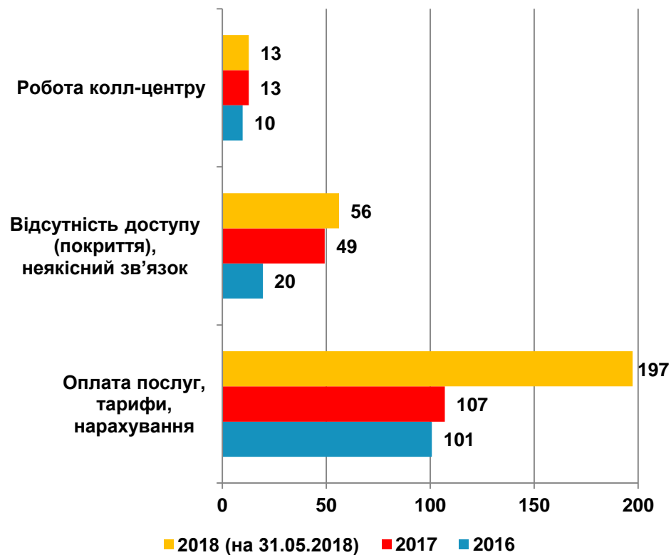
Середньомісячна кількість звернень до НКРЗІ щодо послуг мобільного зв'язку за 2016 – 2018 роки